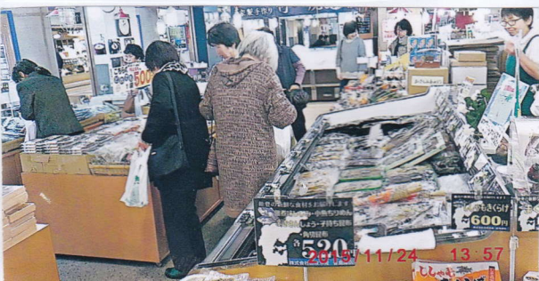
最後の立寄り所で今晚のおかずを買う(能登食祭市場)

ありがとうございました。三役の皆さん午後三時半過ぎに頼成に帰りました。の夕餉のご馳走を買い求め、