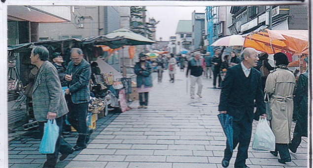
買物客、観光客で賑う輪島・朝市

ありがとうございました。三役の皆さん午後三時半過ぎに頼成に帰りました。の夕餉のご馳走を買い求め、