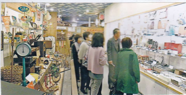
一階の昭和博物館を見る参加者。二階はおもちゃ館